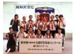
【総体・コンクールの様子】