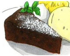
チョコレートケーキ